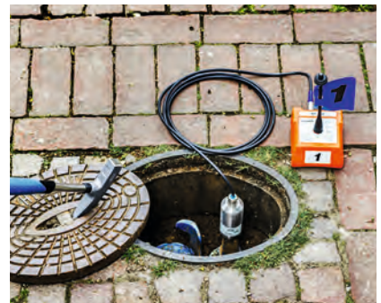
Korrelieren mit dem Funksender RT 200 und dem Universalmikrofon UM 200