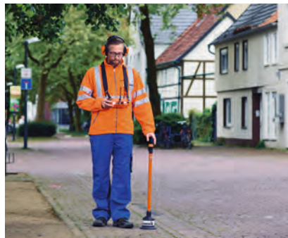
Lokalisieren mit dem SeCorrPhon AC 200