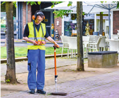
Vororten mit dem SeCorrPhon AC 200